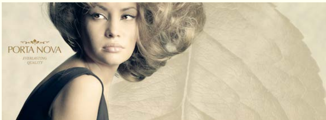
Porta Nova - Everlasting quality